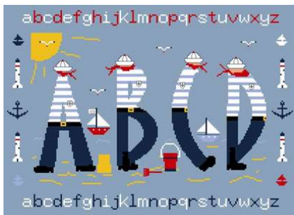
Un alphabet à la mer