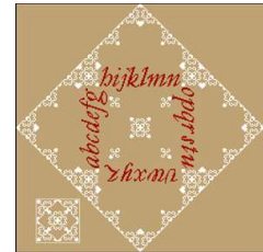
Mon cœur dans ses états