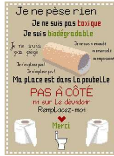
je ne pèse rien