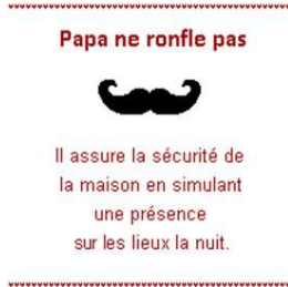
Papa ne ronfle pas