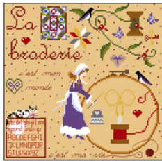
La broderie c'est mon monde - C'est aussi à Noël 'C'est aussi à Halloween