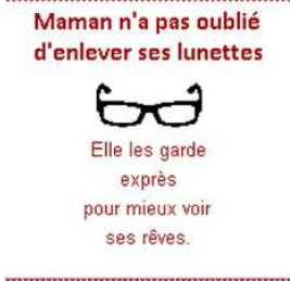
Les lunettes de maman