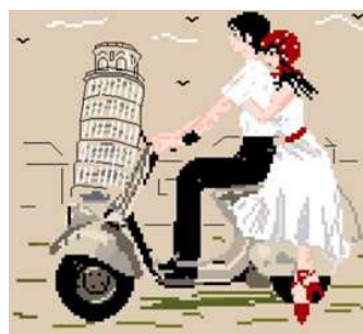
Voyage en Italie