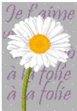
A la folie