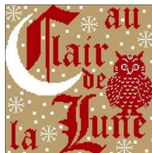
Au clair de la lune