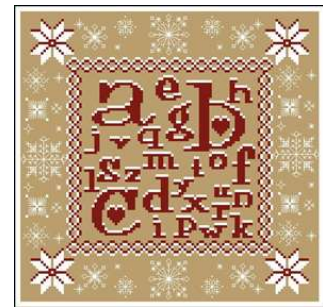
Un alphabet à la neige