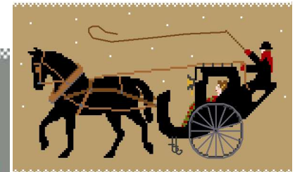
Le fiacre londonien