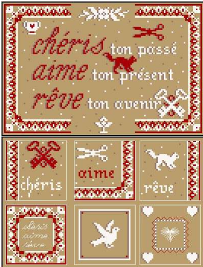
Chéris, aime, rêve