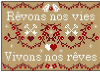
Rêvons nos vies