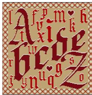
De A à Z